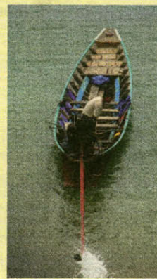
De traditionele long boat is een populair vervoersmiddel in de Thaise jungle.