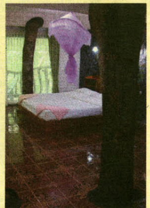
In de boomhut, met aan weerszijde van het bed een boom.

Speurders opgeven? Ga naar www.speurdersindekrant.nl