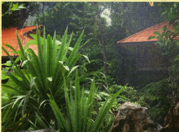
De Tree Top hutten zijn – de naam zegt het al – hoog in de bomen gebouwd.

Informatie over een verblijf in de raft houses of Tree Top Resort: www.greenwoodtravel.nl